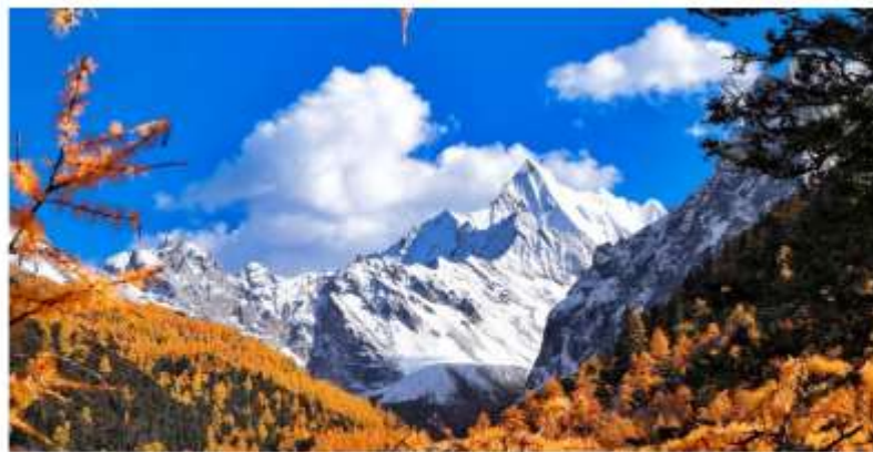
MLTFU3U01 - สี่ตรุณี ต้าตู้กราเซีย หวงหลง จิวจ้ายโกว 7D6N