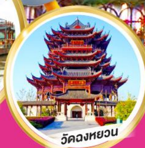
วัดคงหยวน