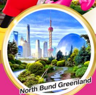
North Bund Greenland